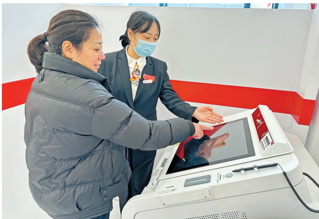
银行工作人员热情为市民提供金融服务

本报讯(记者 祝贺 文/图)1月9日,浙商银行乐山分行乔迁开业,新址位于中心城区太白路863号。乔迁后,该行将持续以全面、优质、高效的金融服务,赋能城市发展,增进民生福祉。