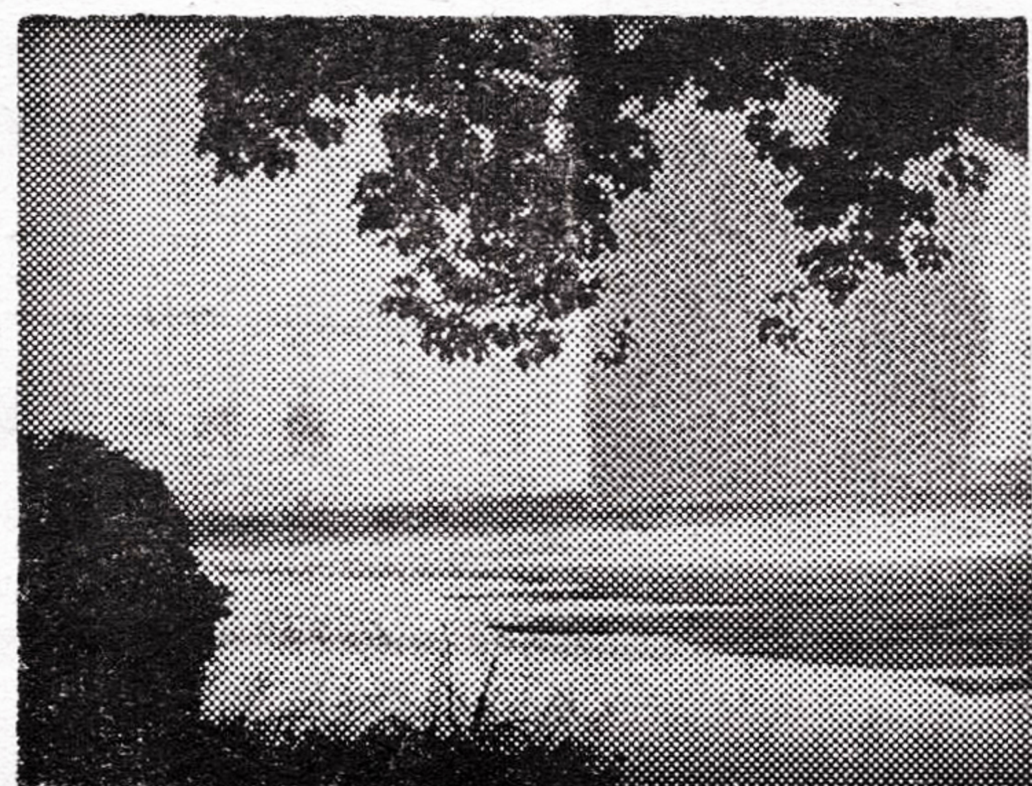
观音滩小景

市机砖厂在实行经济承包责任制后，狠抓生产的同时认真抓好职工工业余文体活动。承包几个月来，开展过学习、乒乓球等比赛。利用会议室布置了一个美观漂亮的跳舞室，购买了16毫米电影机一部，职工们每个星期可看上一次电影；购买了22英寸彩色电视机一部，手风琴一个，胡琴二把等娱乐器具；新修了篮球场一个，还新修花园十个，栽了十几种花草树木，供职工休息时游览观赏。丰富多彩的业余文体活动，改变了职工们的精神面貌，同时有力地促进了生产发展。（张树林）