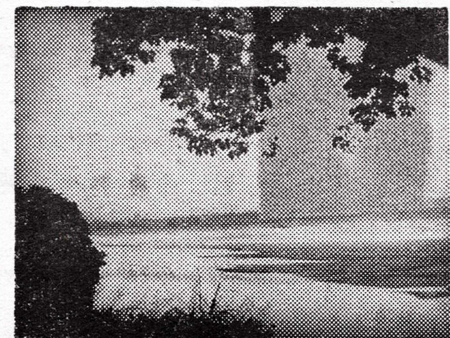
观音滩小景