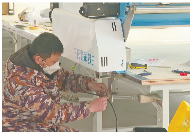
曜眸纺织项目在积极推进项目土建的同时,加快纺织设备安装调试。