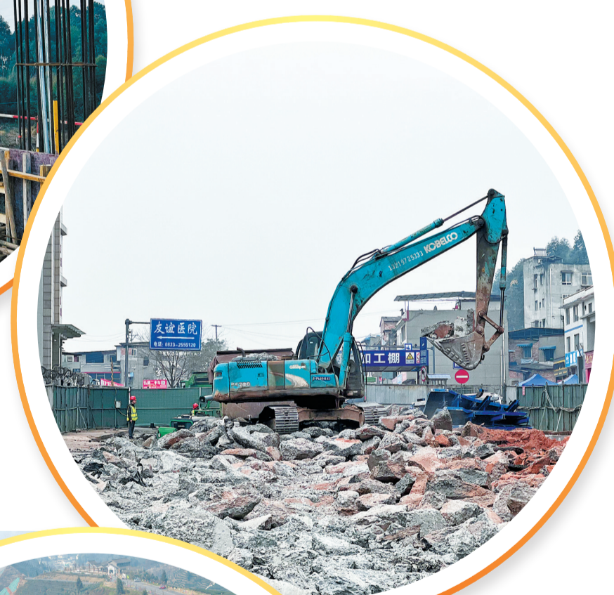
▲ 高速乐山城区连接线工程二期(全福连接线)施工现场