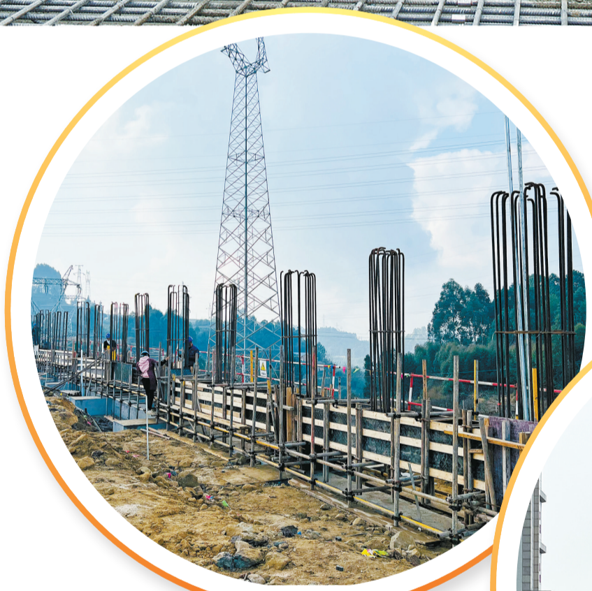
位于中国绿色硅谷核心区的乐山南500千伏变电站正加快建设