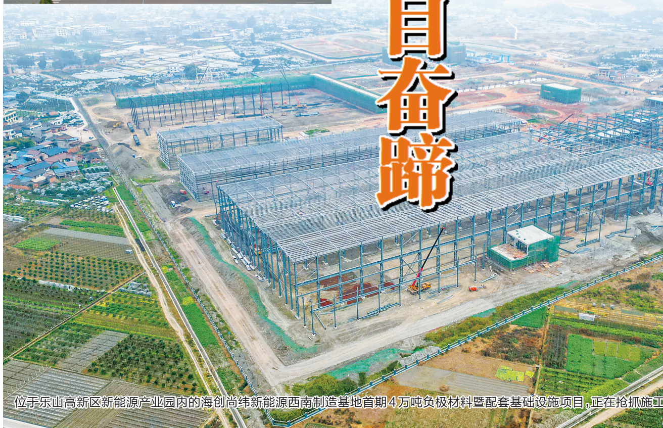
位于乐山高新区新能源产业园内的海创尚纬新能源西南制造基地首期4万吨负极材料暨配套基础设施项目,正在抢抓施工进度。