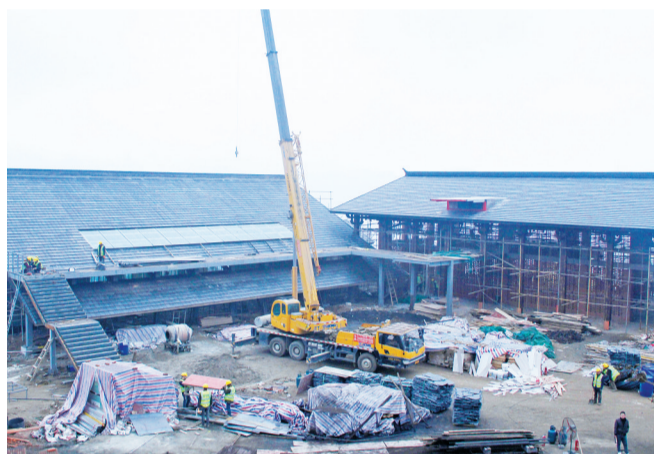
峨边彝族自治县新林镇茗新村太阳坪片区易地扶贫搬迁集中安置点农文旅产业园区施工现场