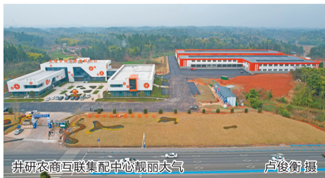
井研农商互联集配中心靓丽大气