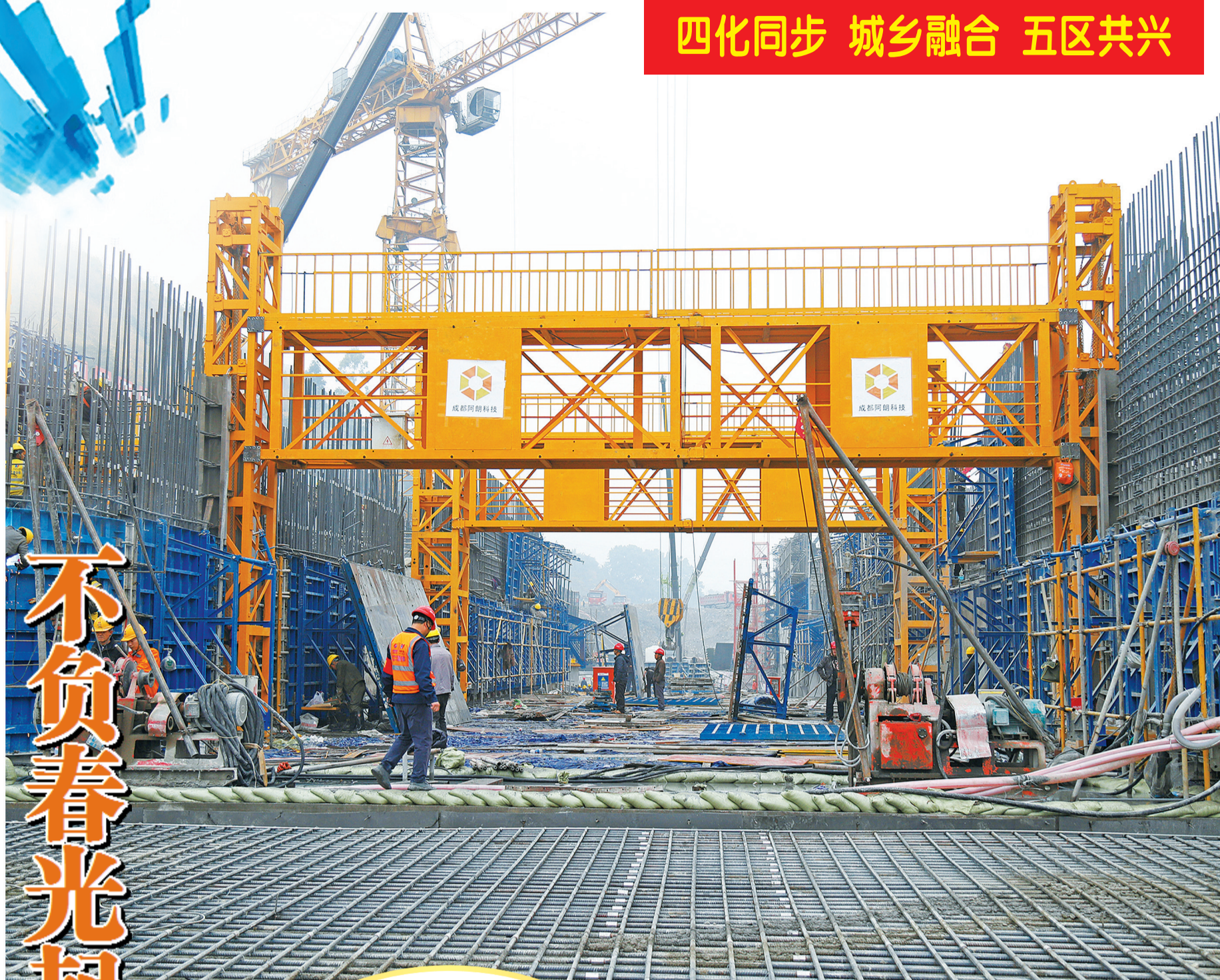
金口河区枕头坝二级水电站、沙坪一级水电站建设现场