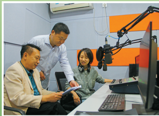
主创团队部分成员