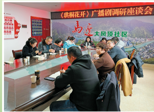
广播剧调研座谈会