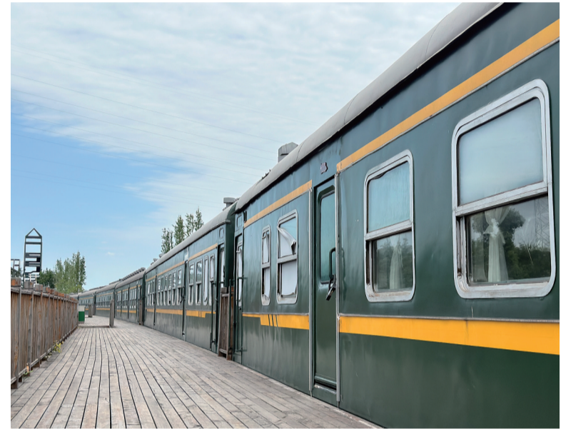
别具特色的火车厢民宿

本报讯(记者 黄曦文/图)背上行李,登上绿皮火车,曾经许多人就这样踏上了诗和远方的旅途……如今,沙湾区将绿皮火车搬到了城区,在车厢设立了特色餐饮、住宿等多种业态,一个名叫“夜泊车居”的火车民宿便坐落在沙湾区沫若戏剧文创园二期内。这是全市首个以“绿皮车厢”为载体的特色民宿,因其复古风格深受游客青睐。