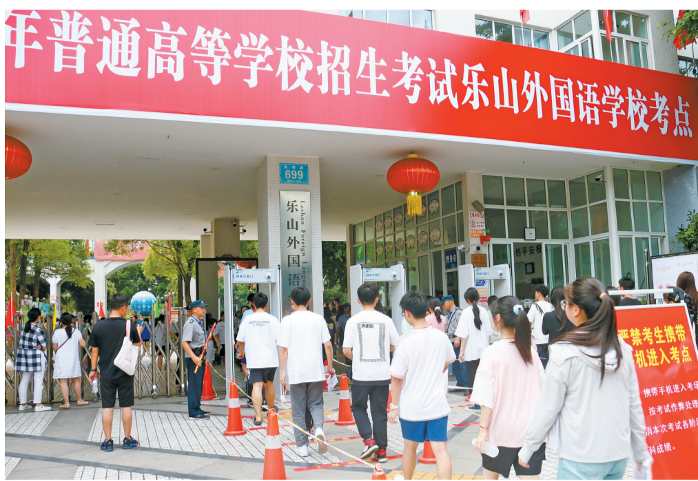
考生进入考点熟悉考场

同时,协调本地经信、通信运营商等部门,对所有考点手机信号实施屏蔽检测和降频测试。高考期间,通信部门降低考点内手机信号频率,限制手机网络自动优化,利用5G手机信号屏蔽设备,实现考试区域手机信号全屏蔽。