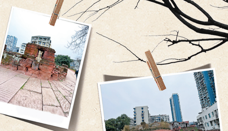
古城墙今犹在