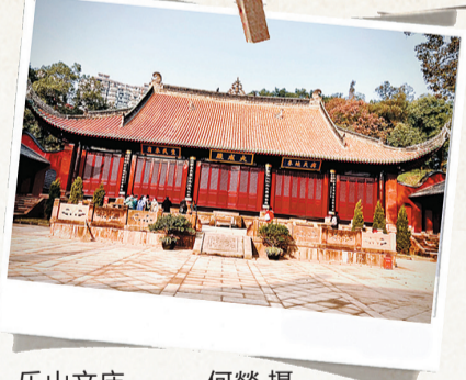
乐山文庙