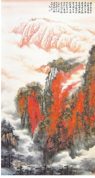
胡真来《峨眉秋韵》 资料图片