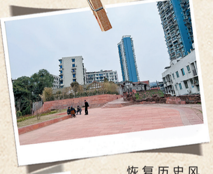
恢复历史风貌的桂花楼