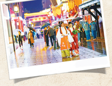
漫游古城