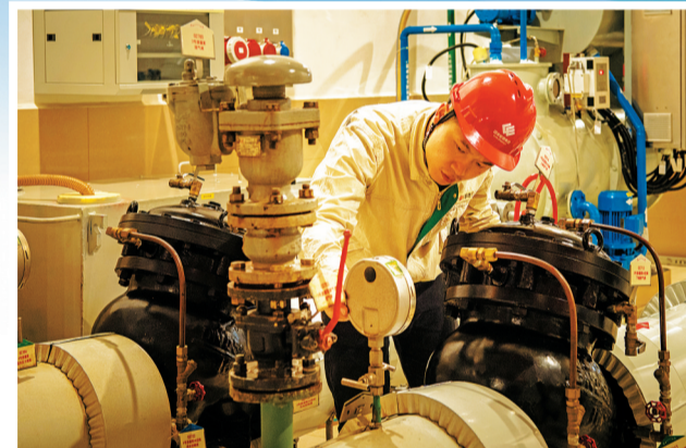
电站工作人员正在检查仪器