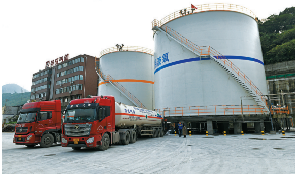
荣成气体服务云贵川渝