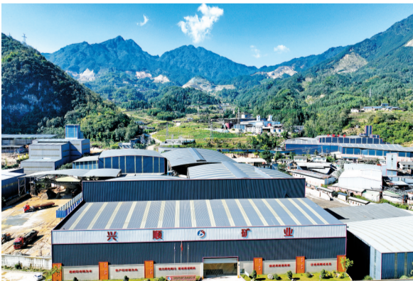
兴顺矿业规整的厂区

充分发挥绿色有机地标农产品的品质优势,实施农林产品加工配套建设项目,发展预制菜、调味品、果酒饮料等精深加工产品,健全种植、采购、收购、加工、销售等产业链利益联结机制,加快培育一批拳头产品和潮流新锐品牌,推动食品加工产业向价值链高端延伸。加快农业标准化体系建设,加强地理标志产品培育,实施“峨字号”品牌培育计划,以“峨岭云边”区域品牌为引领,加快农产品加工HACCP认证,提升“峨边竹笋”“峨边腊肉”“峨边蜂蜜”等特色品牌影响力……绿色工业的峨边画卷正在绘就。