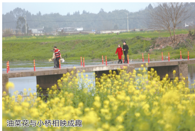
油菜花与小桥相映成趣