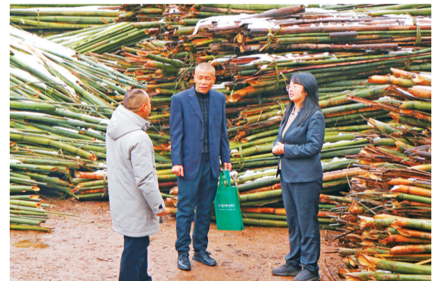
农行乐山沐川支行工作人员上门收集林竹产业链农户资金需求