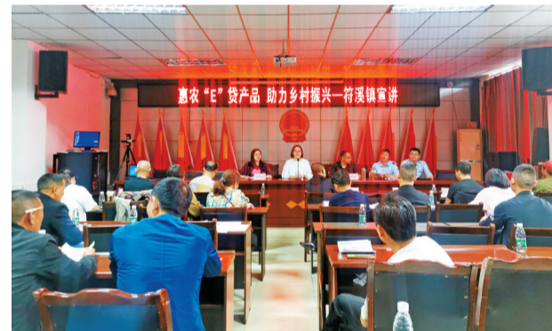
农行乐山分行“千人计划”交流干部到峨眉山市符溪镇开展“普惠E贷产品 助力乡村振兴”宣讲