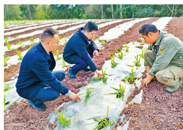
农行乐山井研县支行工作人员深入井研县马踏镇南河村农户玉米地实地开展粮农e贷调查

▶▶▶金融是“国之大事”,关系中国式现代化建设全局。经济是肌体,金融是血脉,两者共生共荣。自2013年党的十八届三中全会提出“发展普惠金融”以来,我国普惠金融取得长足进步,构建起多层次、广覆盖的中国特色普惠金融体系。普惠金融10年,农行乐山分行扎根嘉州大地,助企于百业,利民于共富,书写金融兴企惠民助发展的时代篇章。