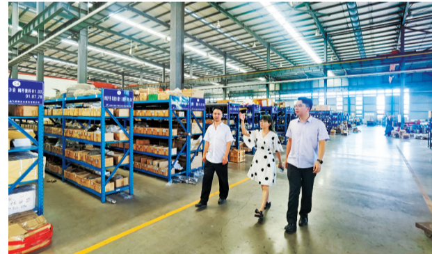
农行乐山直属支行客户经理走访四川长仪油气集输设备股份有限公司