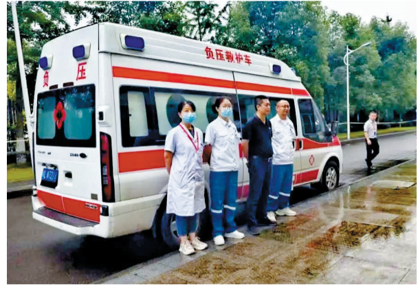
医护人员坚守在考点外