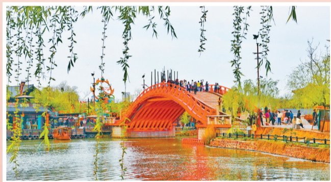
网红景区清明上河园