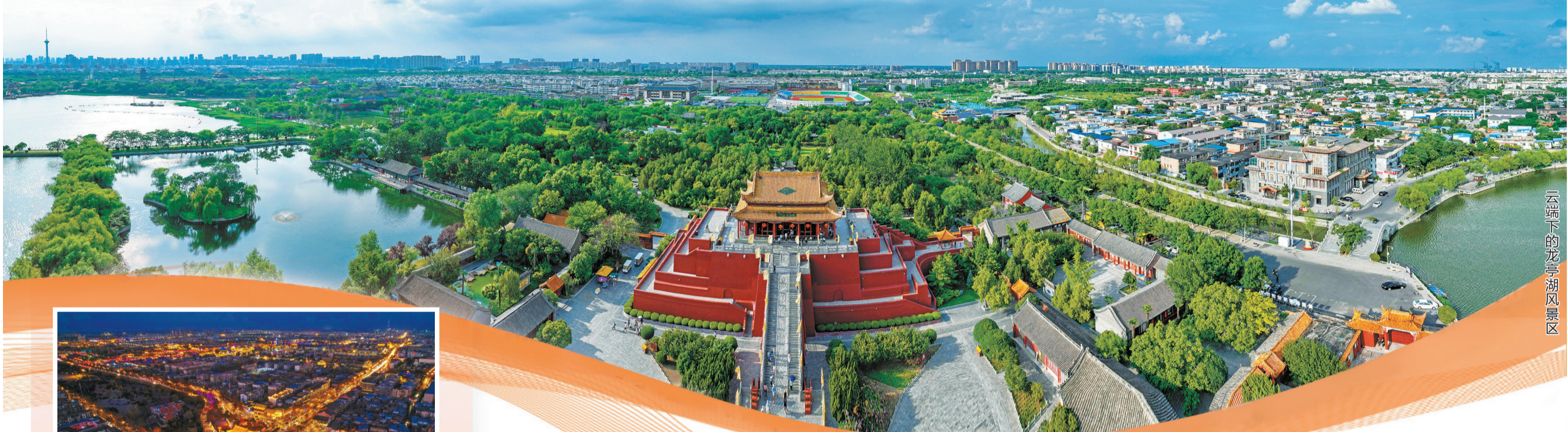
云端下的龙亭湖景区