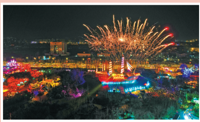
开封《大宋·东京梦华》实景演出