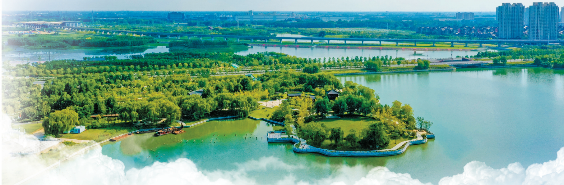
开封黑岗口调蓄水库