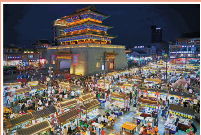
开封鼓楼夜市的浓浓烟火气