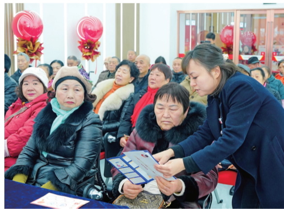
积极开展金融知识宣教活动

金融为民,消保先行。乐山商行按照市委“节奏更快、效率更高、质量更优”工作要求,积极履行国有控股银行责任担当,高度重视消费者权益保护工作,通过系列“为民办实事”举措,将消费者权益保护融入企业治理、经营管理各个环节和全面风险管理体系,用实际行动践行金融为民理念,传递金融温度。