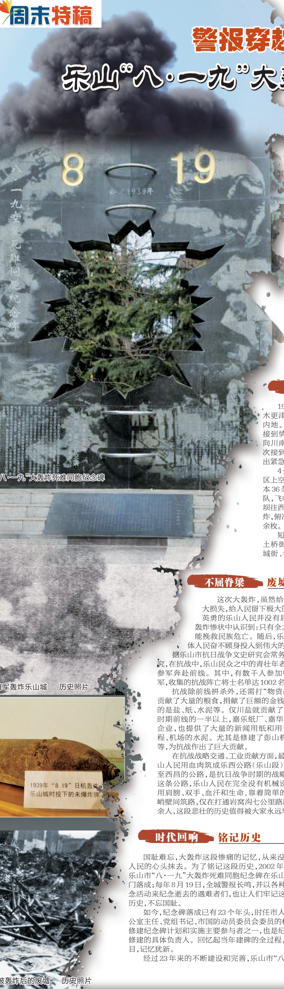
“八·一九”大轰炸遇难同胞纪念碑

我国文旅市场正处于结构优化、品质提升的关键期。从“有没有”到“好不好”,从“打卡式”到“沉浸式”,从“向外探索”到“向内观照”,需求变化为供给创新提供了清晰方向。与其一哄而上复制“网红项目”,不如想办法与游客建立更紧密的情感联结。将游客的“情绪账单”纳入发展考量,把人的感受作为重要指标,文旅产业高质量发展之路才能越走越宽,更好满足群众美好生活向往,为人们心中的诗和远方增添更多精彩。