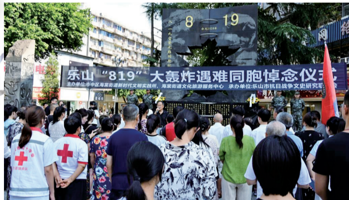
8月19日,乐山“八·一九”大轰炸遇难同胞悼念仪式举行

那年盛夏,乐山遭遇了历史上最黑暗的一天。36架日军轰炸机肆虐乐山城区,短短10分钟不到,繁华的街道化为焦土,1218名同胞伤亡,一万余户家庭支离破碎……86年过去,这段伤痛从未被遗忘。