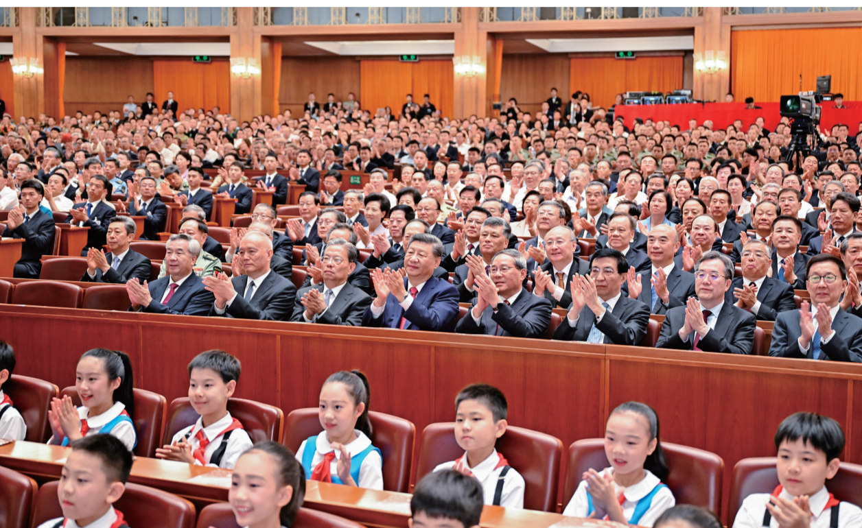
9月3日,纪念中国人民抗日战争暨世界反法西斯战争胜利80周年文艺晚会《正义必胜》在北京人民大会堂隆重举行。习近平、李强、赵乐际、王沪宁、蔡奇、丁薛祥、李希、韩正等党和国家领导人,与约6000名中外人士一起观看晚会,共同纪念这个光辉的日子。新华社记者 李响摄

新华社北京9月3日电 歌声嘹亮,唱响胜利华章;舞姿雄壮,展现正义力量。纪念中国人民抗日战争暨世界反法西斯战争胜利80周年文艺晚会《正义必胜》3日晚在北京人民大会堂隆重举行。习近平、李强、赵乐际、王沪宁、蔡奇、丁薛祥、李希、韩正等党和国家领导人,与约6000名中外人士一起观看晚会,共同纪念这个光辉的日子。人民大会堂万人礼堂灯火辉煌,二楼舞台悬挂着“铭记历史 缅怀先烈 珍爱和平 开创未来”的横幅。舞台正中,“正义必胜”4个金色大字熠熠生辉,庄严雄伟的长城造型象征着中华民族不屈的精神脊梁。晚会开始前,少先队员向前来观看演出的抗战老战士老同志代表献花。随后,老战士老同志们在少先队员的簇拥下,来到大礼堂观众席就座,全场起立报以热烈掌声,向他们致以崇高敬意。19时55分许,欢快的迎宾曲响起,习近平等领导同志步入大礼堂,同抗战老战士老同志代表亲切握手。在8声庄严肃穆的钟声中,音诗画《山河铭记》拉开整场晚会的序幕。第一场“怒吼吧,黄河”中,情境表演《中华民族到了最