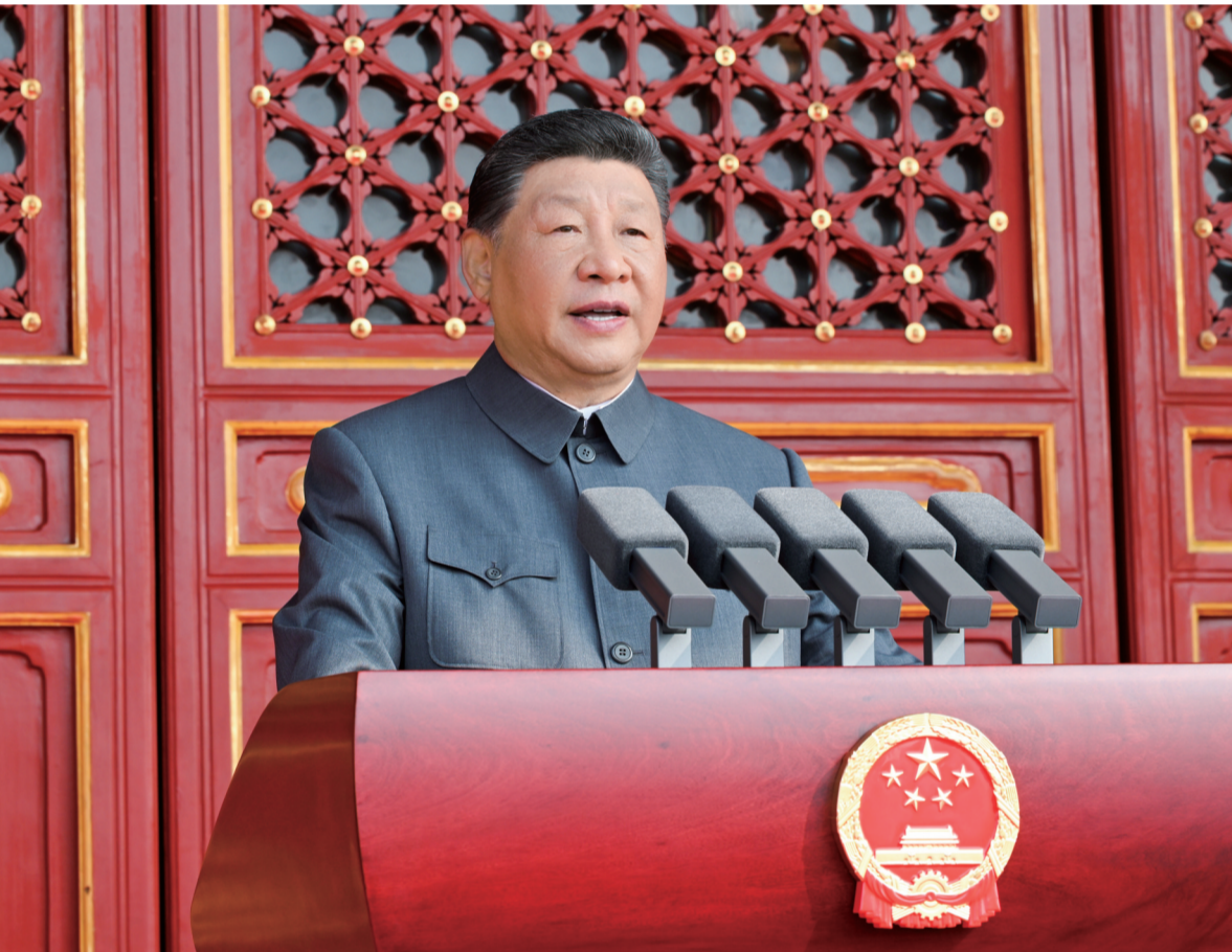
9月3日,纪念中国人民抗日战争暨世界反法西斯战争胜利80周年大会在北京天安门广场隆重举行。中共中央总书记、国家主席、中央军委主席习近平发表重要讲话。

李强主持 赵乐际王沪宁蔡奇丁薛祥李希韩正出席 61位外国领导人及有关国家高级别代表、国际组织负责人、前政要等应邀出席大会