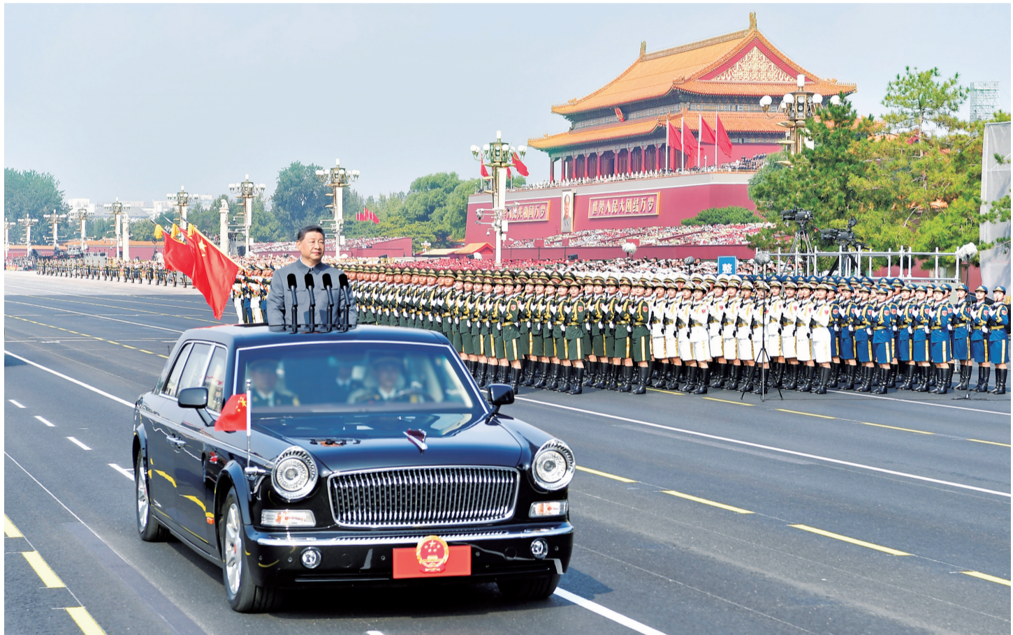
9月3日,纪念中国人民抗日战争暨世界反法西斯战争胜利80周年大会在北京天安门广场隆重举行。这是中共中央总书记、国家主席、中央军委主席习近平检阅受阅部队。

新华社北京9月3日电 铭记伟大历史胜利,凝聚正义和力量。9月3日上午,纪念中国人民抗日战争暨世界反法西斯战争胜利80周年大会在北京天安门广场隆重举行,以盛大阅兵仪式,同世界人民一道纪念这个伟大的日子,共同开创更加光明的未来。中共中央总书记、国家主席、中央军委主席习近平发表重要讲话并检阅受阅部队。