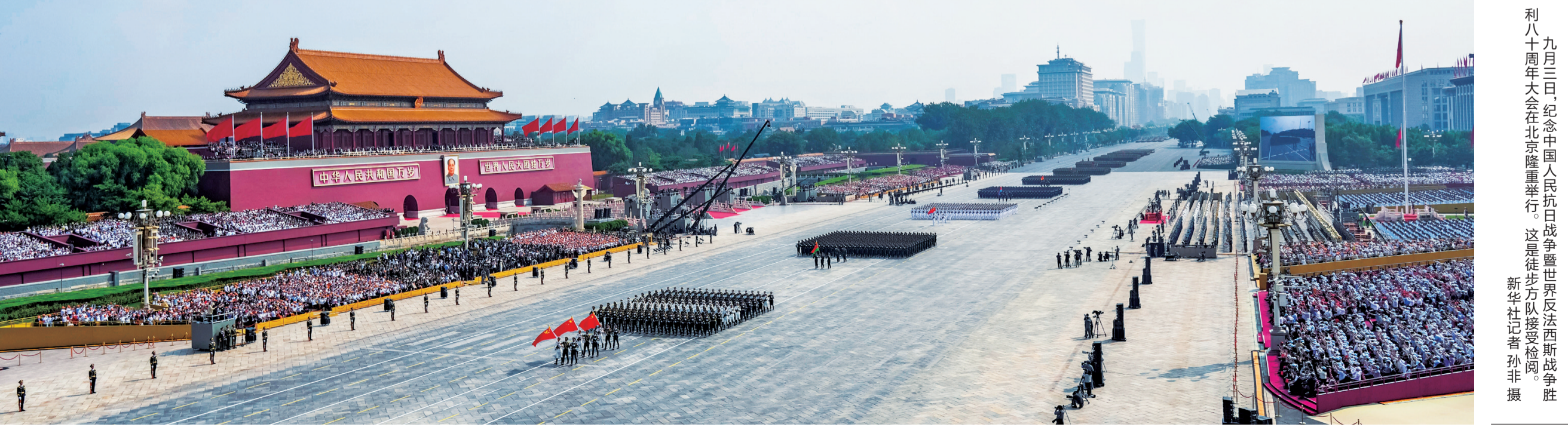
九月三日,纪念中国人民抗日战争暨世界反法西斯战争胜利80周年大会在北京隆重举行。这是徒步方队接受检阅。

习近平最后强调,中华民族伟大复兴势不可挡! 人类和平与发展的崇高事业必将胜利!(讲话全文见第3版)