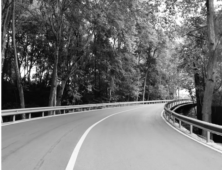
项目样板工程路段

本报讯(记者 曾梦园 文/图)近日,记者在峨眉山市黄湾镇看到,X141峨洪路杨岗至洪雅界段旅游化改造项目建设正如火如荼进行。工人们加固开裂路面,并在易塌方路段铺设防护网,各项施工有序推进。