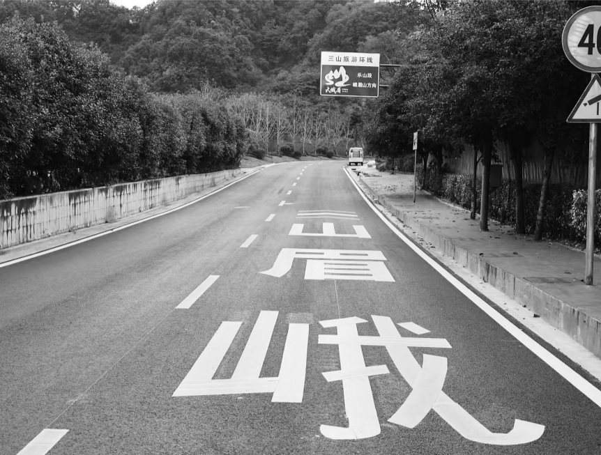
项目样板工程起点