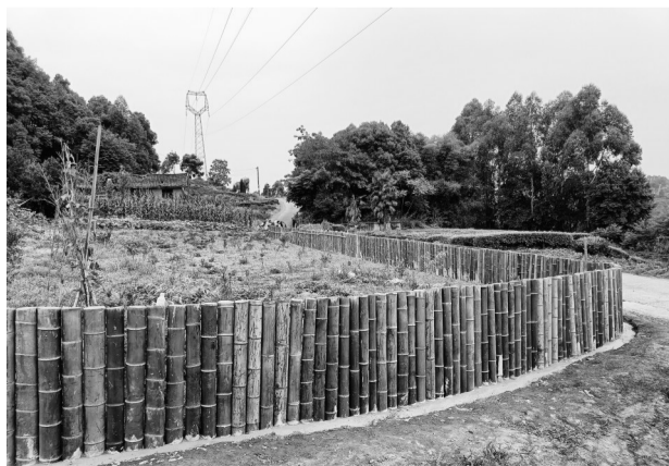
环境优美的“微田园”