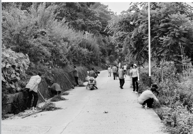
村民共同打扫卫生

村规民约的实施受到村民们的普遍认同,这种认同感转化为实际行动:在“荒山”变“茶山”的项目中,村民们一致通过,积极参与;在道路拓宽工程中,40多名村民主动投工投劳,不计报酬;在连续举办9届的“最美先家人·醉美先家情”评选中,涌现出“好婆婆”“好媳妇”等各类道德模范200余人。如今,先家村通过18字村规民约,将“村里事”变成了“家家事”,激发了村民的主人翁精神,奠定了乡村善治的坚实基础。先家村将持续完善“积分制”,创新参与机制,把遵守村规民约进行细化量化,设置更加因地制宜的积分项目。同时,继续拓宽议事渠道,坚持“民事民议”,利用坝坝会、村民代表会等多种形式,确保村民“有话说、说了管用”。金山镇政府工作人员表示,将强化典型引领,深入总结先家村经验,通过组织现场观摩会、经验交流会等方式,让其他村(社区)“看得懂、学得会、用得上”,持续推动乡村振兴。