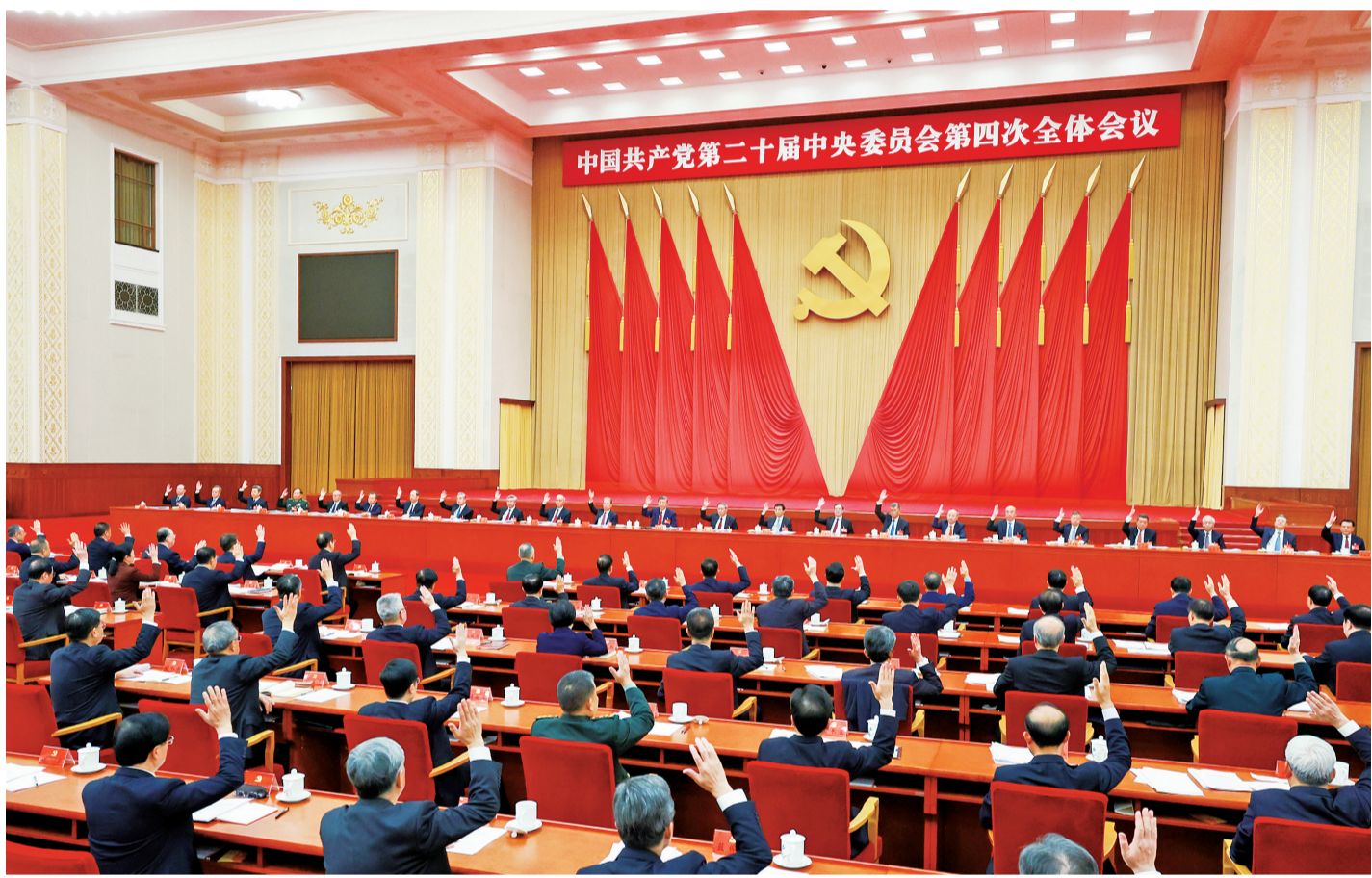
中国共产党第二十届中央委员会第四次全体会议,于2025年10月20日至23日在北京举行。中央委员会总书记习近平作重要讲话。