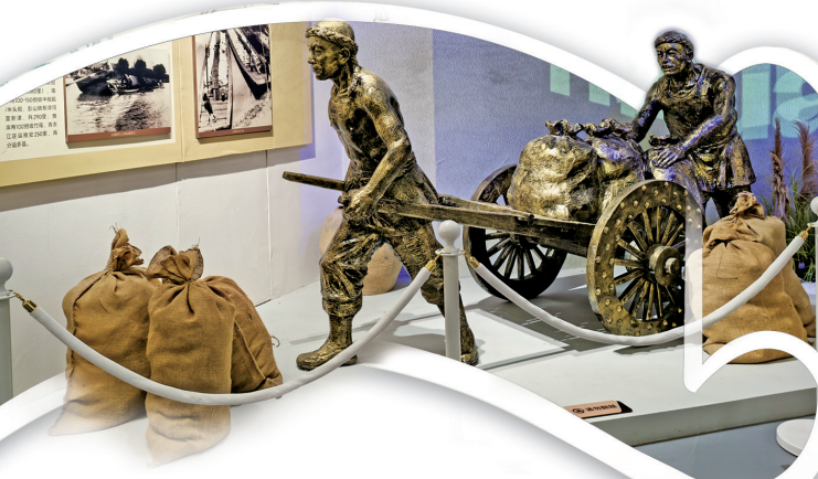
本组图片为五通桥盐文化博物馆内部展陈作品。