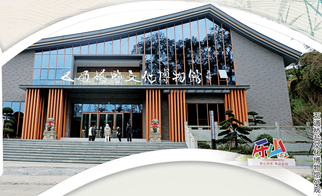
五通桥盐文化博物馆外观。