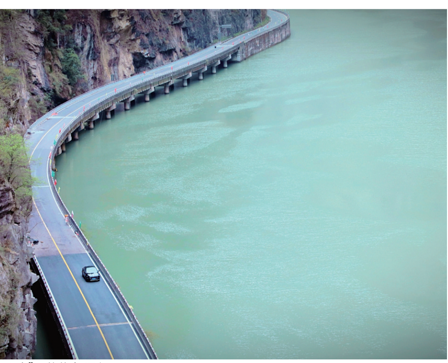
“最美水上公路”即将恢复通行

据悉，为配合道路通车，金口河区将同步推出“最美水上公路”旅游打卡系列活动，诚邀旅游达人、摄影爱好者等参与，进一步扩大“最美水上公路”的知名度和吸引力。