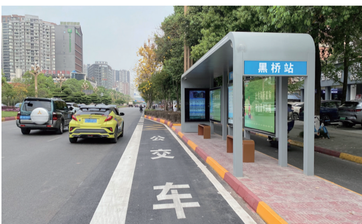
新投用的现代化智慧候车亭

本报讯(记者 罗晓玲 文图)随着乐山主城区“四公一农”建设提升三年行动持续推进，公交站台逐步升级更新。4月16日，“马铺儿”“黑桥”双向4个现代化智慧候车亭在中心城区柏杨西路正式投用，为乘客候车带来新的体验。据悉，这是乐山主城区投用的首批现代化智慧候车亭。