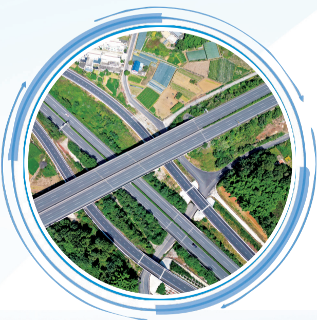
乐山交通网络内联外畅