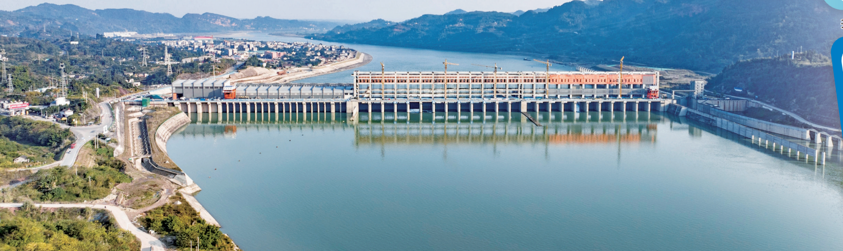
岷江龙溪口航电枢纽