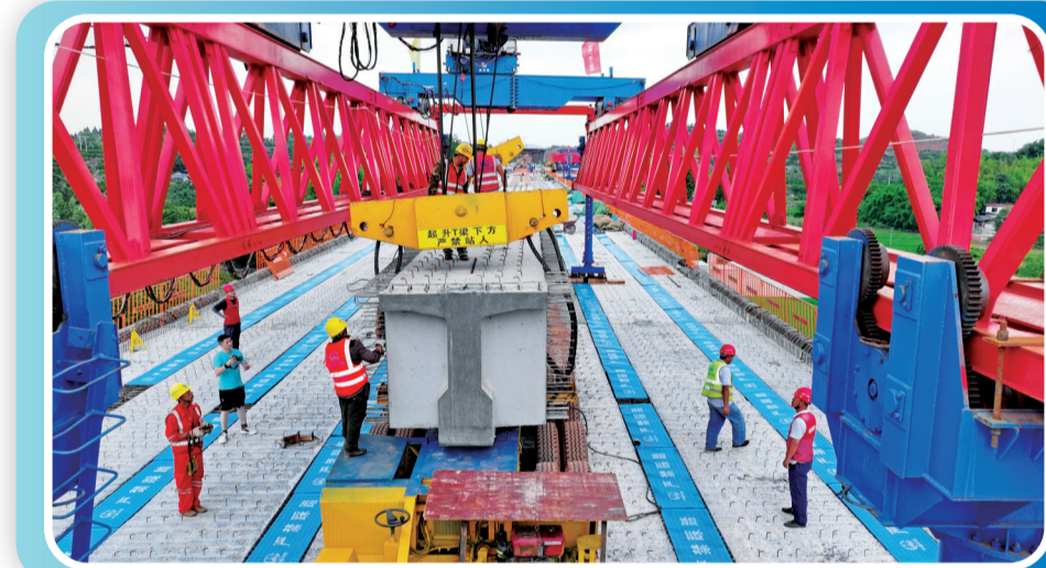
资乐高速曾家沟大桥建设现场