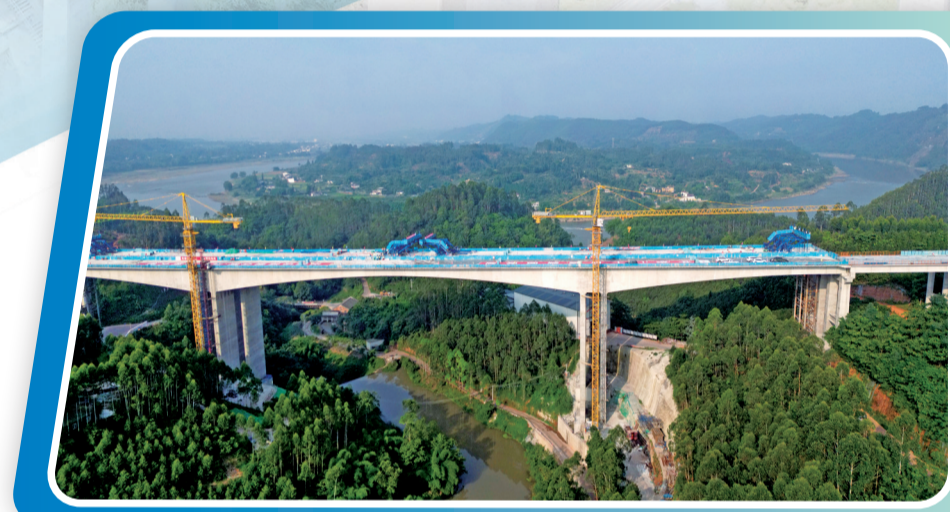
天眉乐高速两河口特大桥双幅贯通