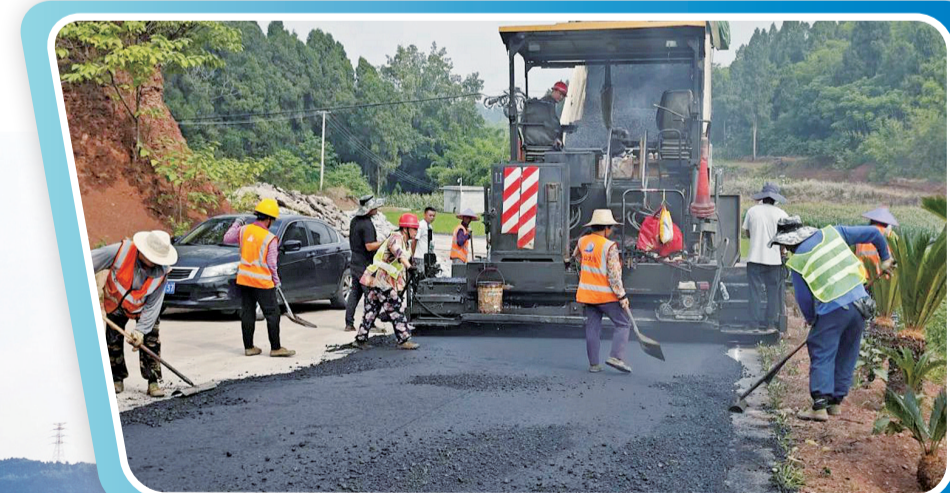
井研县幸福美丽乡村路建设加速