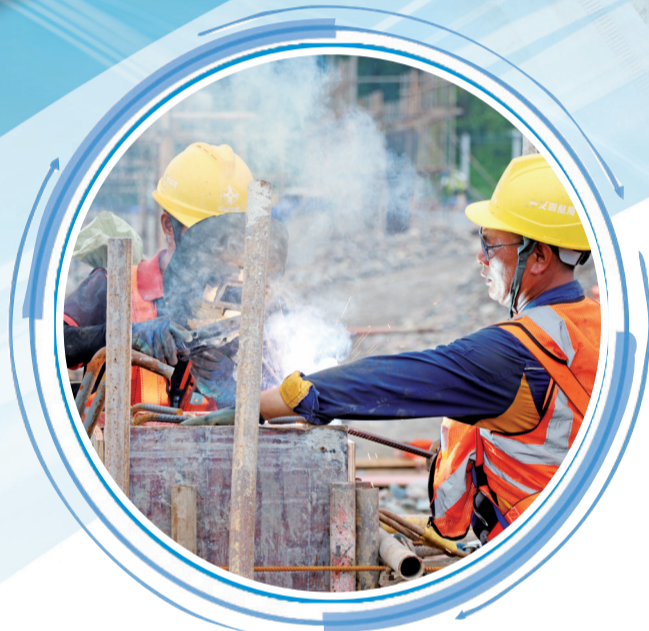
岷江东风岩航电枢纽,工人正在进行焊接作业

冲刺“枢纽”,攻坚提速!当前,尽管高温炙烤,但建设者们依旧顶烈日、冒酷暑,激情奋战,争分夺秒推进工程建设,加快交通立体网络打造,赋能经济发展。 记者 宋雪