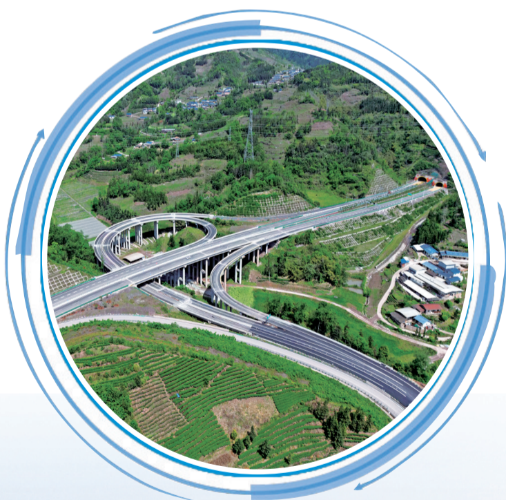
乐西高速马边至昭觉段路基全线贯通