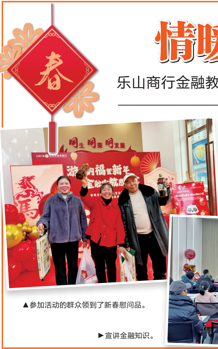
▲参加活动的群众领到了新春慰问品。