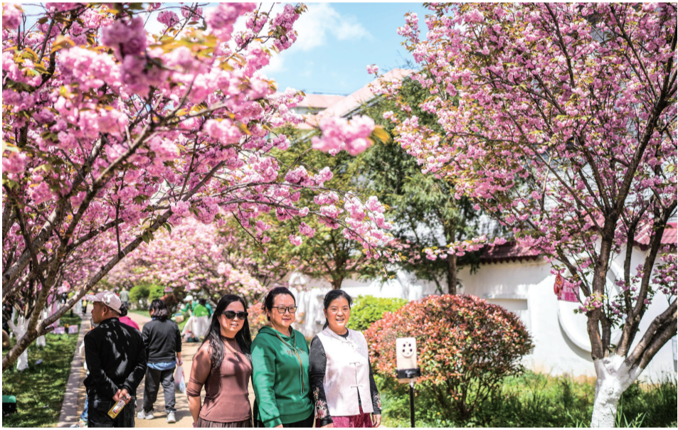
▲近日,贵州省六盘水市钟山区水城河畔樱花长廊春意正浓,花香四溢,吸引众多市民游客前来踏青观赏。近年来,当地依托城区河畔樱花长廊,延伸“赏花+”产业链,将自然景观转化为经济效益。文旅消费联动视听、商超、餐饮等领域,成为激活市场消费潜力新的经济增长点。图为4月3日,市民在六盘水市钟山区水城河畔樱花长廊拍照留念。

此外,通知还要求加快推进户籍、房产、居住证、社保、学籍等入学相关信息的互通共享。制订“教育入学一件事”办事指南清单,线上业务办理实现报名、审核、录取等“一网通办”。线下业务办理简化表格填写和证明材料提交,实现“只进一门”。鼓励有条件的地方探索利用数字化手段提供政策解答、报名指引等智能咨询服务。