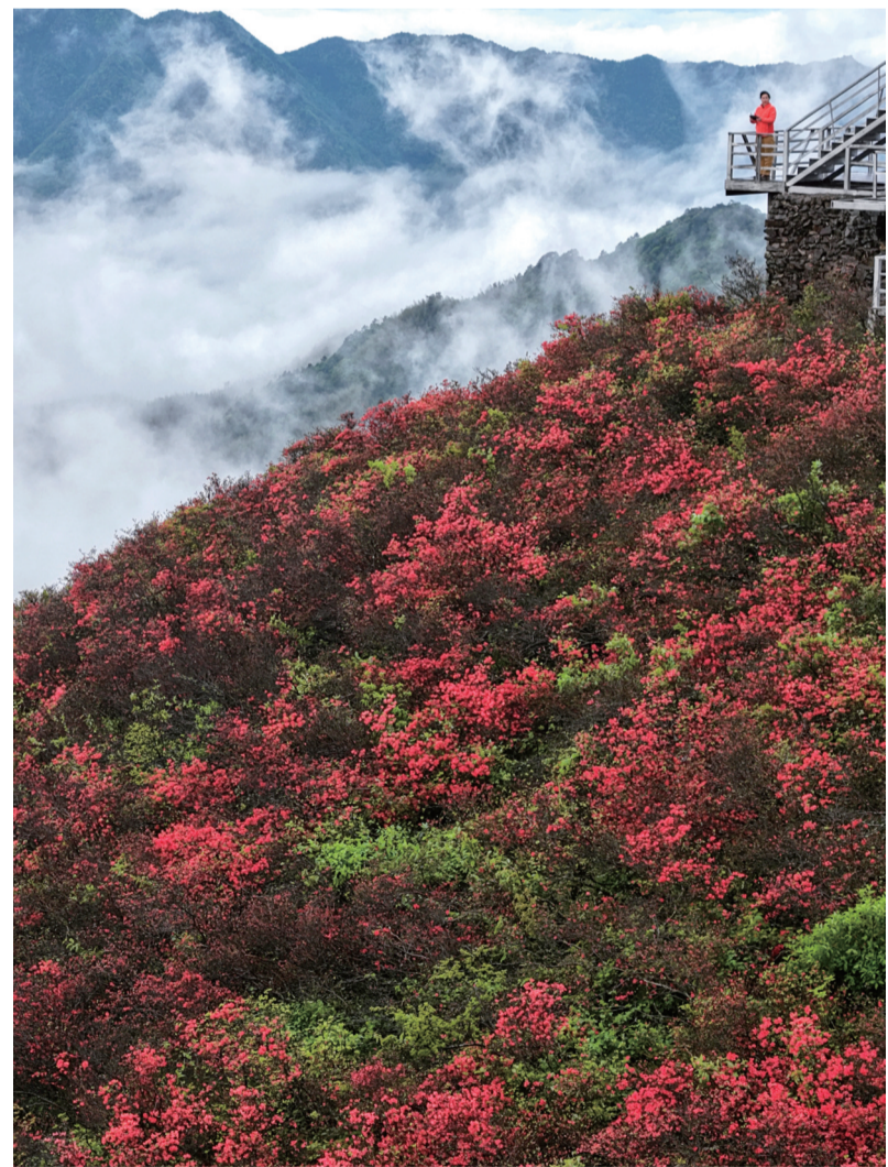
时下,多地野生杜鹃迎来盛花期,漫山杜鹃绚烂如霞,吸引不少游客前来赏花游玩。 图为4月23日,游客在湖南省永州市双牌县阳明山国家森林公园杜鹃花海赏花游玩(无人机照片)。

到这一点,扬州港下了硬功夫:2022年升级泊位,使其具备150吨以上塔筒的接港能力;5年投入3亿多元,并购300多亩场地;改造高速路口,让叶片运输更加便利。 目前,扬州港集聚了泰胜风能、远景能源、三一重能等众多企业,形成了强大的产业集群。“我们不再是单兵作战,而是具备了集群优势。”朱荣林说。 泰胜风能质量中心总经理孔亮对此感受深切。这家2022年建厂的塔筒企业主要面向海外市场,包括中东、东南亚、西亚和欧洲地区。孔亮说,公司距离港口不到一公里,就是为了突破运输瓶颈,“2025年我们交付产品14.3万吨,较2024年增长将近40%”。 夕阳西下,扬州港码头上,巨大的风机叶片整齐排列,如白色羽翼静待启航。高效的生产力,加上供应链的聚合,将中国制造的“风”送往世界,为全球绿色能源发展注入强劲动力。 (新华社北京4月24日电)