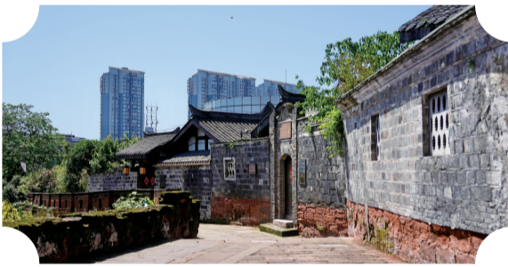
海棠湾巷民居

此外,三江平急两用(一期)项目,将2.5公里滨江岸线改造为兼具排水防涝与文旅价值的城市风景线,肖公嘴城市阳台、大曲口曲艺公园等节点成为市民游客的新去处;“八门十巷”保护提升工程全面展开,板厂街、盐关街等街巷在保留原有风貌的基础上植入现代业态,完工后将串联起上中顺特色街区与滨江观佛核心区,形成沿江游城环线。