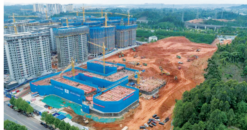
乐山七中通江校区项目建设有序推进。 据微嘉州