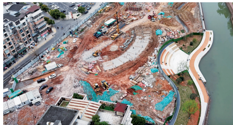
建设中的白燕路西侧柏溪海绵公园。 据乐山住建