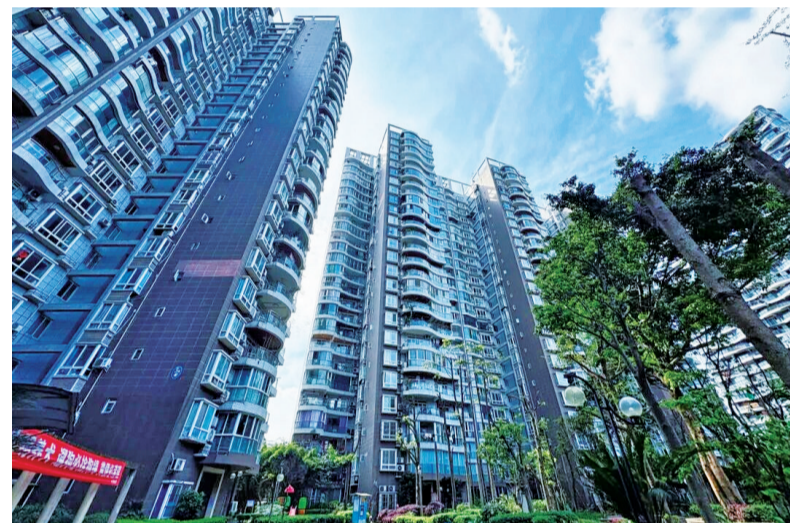
老旧小区电梯焕新,筑牢民生幸福安全线。

近年来,乐山大力实施公园绿地、农贸市场、老旧小区、缓堵保畅等一系列城市更新工程,从路网畅通到小区焕新,从公园增绿到街巷整洁,从出行便捷到生活舒心,用实实在在的“硬举措”,提升了城市“软实力”,让文明城市建设的理念融入肌理,也让幸福感在市民心中悄然升腾。