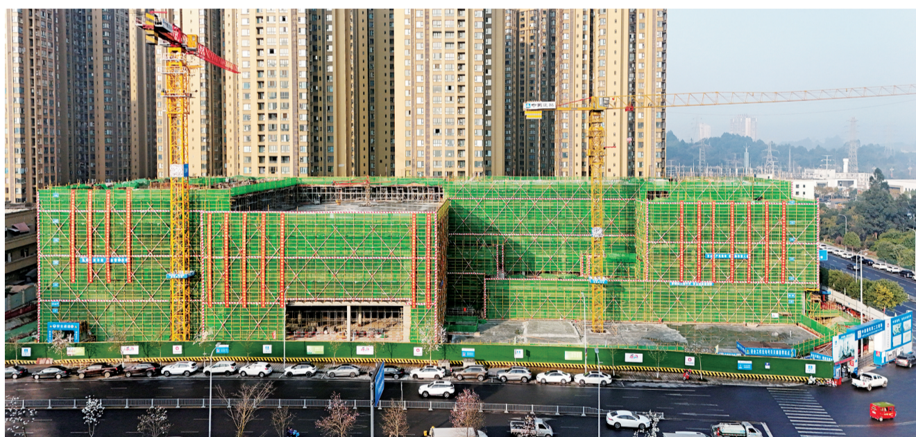
青江里综合服务中心项目全速推进。