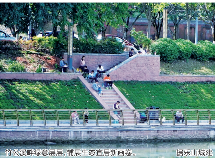
竹公溪畔绿意层层,铺展生态宜居新画卷。 据乐山城建