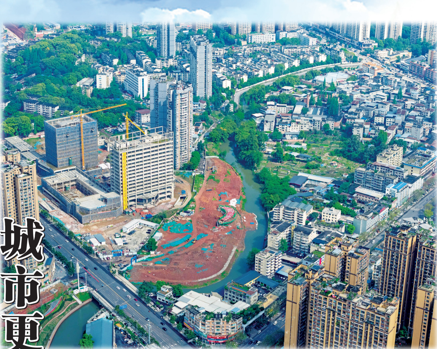
市中区蟠龙公园建设有序推进。