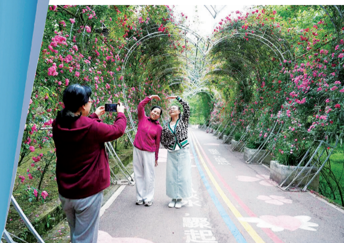
绿心公园内蔷薇花廊悄然走红,成为市民休闲游玩的新晋“网红打卡地”。 据微嘉州