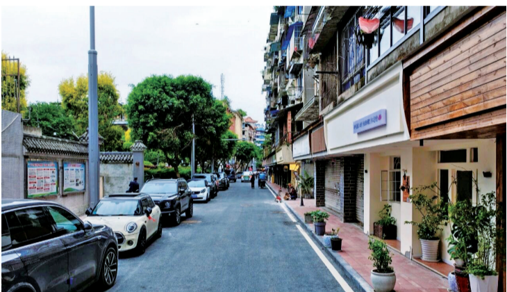
箱箱街路面改造全面焕新。 据微嘉州