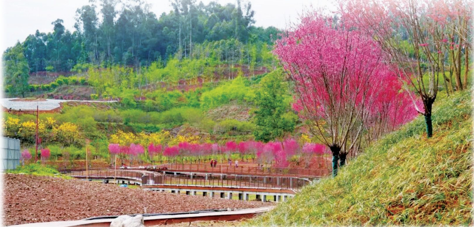
绿心街道城市公园提质改造。 据微嘉州