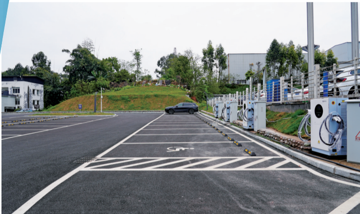
建成投用的长青路停车场。