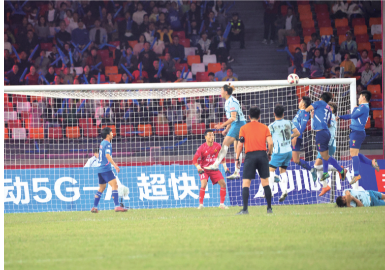
5月1日晚,在乐山奥体中心,2025/2026四川银行四川省城市足球联赛乐山味道非常队主场对阵凉山好医生队。经过激烈角逐,乐山味道非常队最终2:0赢得比赛。图为比赛现场。