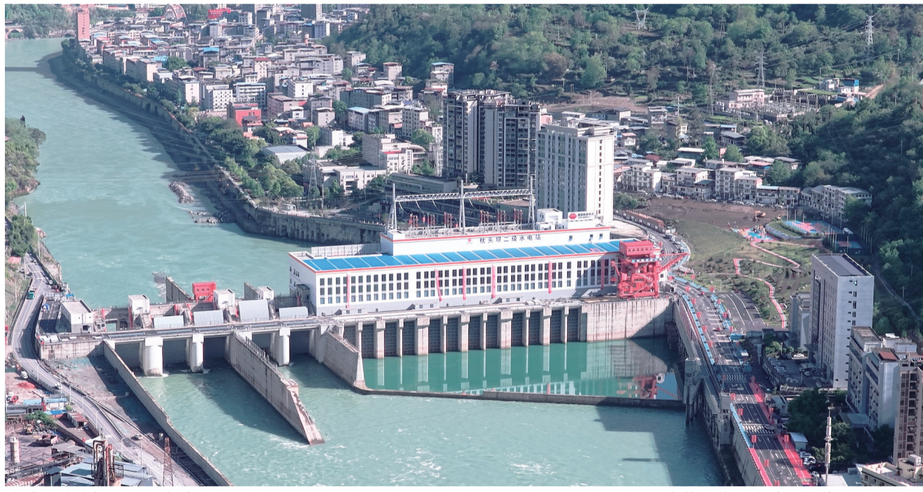
大渡河枕头坝二级水电站。

项目的快速推进,同样离不开地方政府的全方位护航。金口河区委、区政府主动靠前、专班跟进,通过开通绿色通道、全力保障相关要素服务,