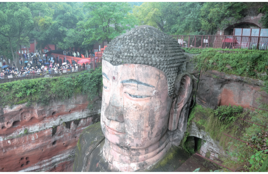
游客游览乐山大佛。

本报讯(记者 戴余乐 谢承宏 祝贺 吴桐 全洪青 文/图)5月1日,“五一”假期首日,乐山大佛景区和峨眉山景区推出多项体验游,让游客沉浸式感受文化与自然魅力。