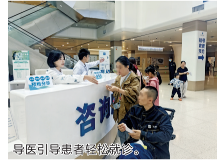
导医引导患者轻松就诊。

假期里4个服务点位都开着，最忙的是病历打印和盖章。有的患者急忙赶过来，忘带身份证，我们帮着协调手机端电子凭证；有的老人不会用自助机，我们就一步步带着弄。少让患者跑一趟，就是我们最大的成就。