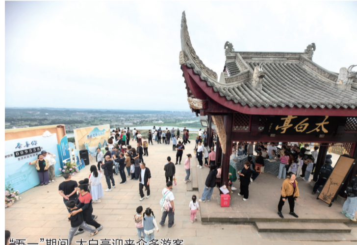
“五一”期间,太白亭迎来众多游客。

目前,山上的见青山咖啡馆、太白饮茶馆、锦江云驿露营地已经开放,后续还将新增山月居餐厅、荔下民宿和荔枝文化展览馆。下一步,还将打造无动力乐园、萌宠乐园、滑翔伞、房车营地等新业态,并与平羌大佛等文物古迹联动,沿线布局特色民宿、江景餐厅,形成“旅游公路串联+主题节点联动”的全域旅游格局。