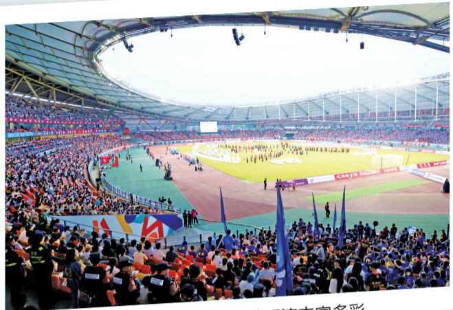
川超比赛,乐山味道非常队主场文艺展演丰富多彩。