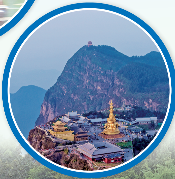
►“五一”假期,无人机航拍峨眉山金顶万佛顶。