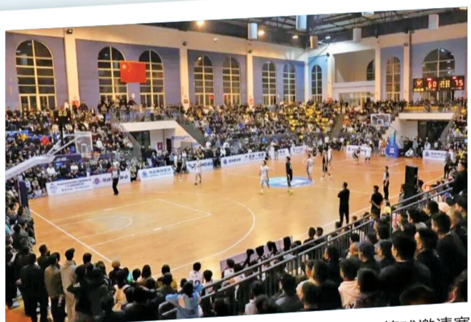
4月29日至5月3日,“越马赶梦”第四届男子篮球邀请赛据今日马边火热开打。