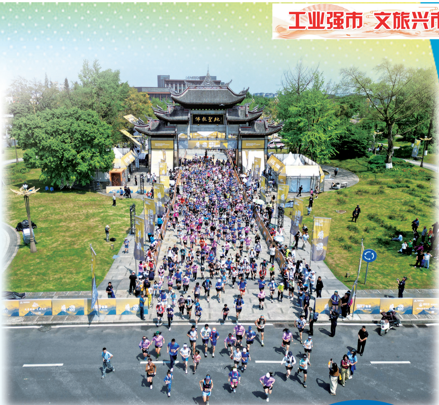
2026峨眉山越野挑战赛,开创“双周赛+户外嘉年华”模式。