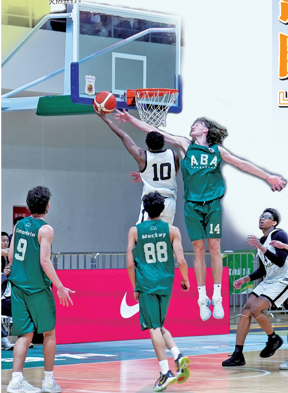
4月30日至5月2日,U17国青男篮国际对抗赛(犍为站)燃情开赛。