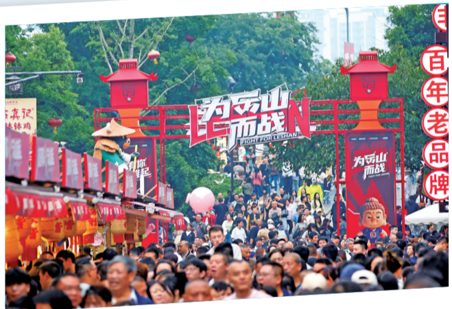
“五一”假期,市中区苏稽古镇人气爆棚。