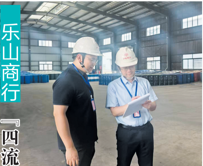
银行工作人员(右)深入企业一线,详细了解资金需求。

中国人民银行乐山市分行相关负责人表示,接下来,他们将通过线上线下联动的方式,携手相关金融机构持续走进社区、企业,推动金融科技知识惠及更多市民。