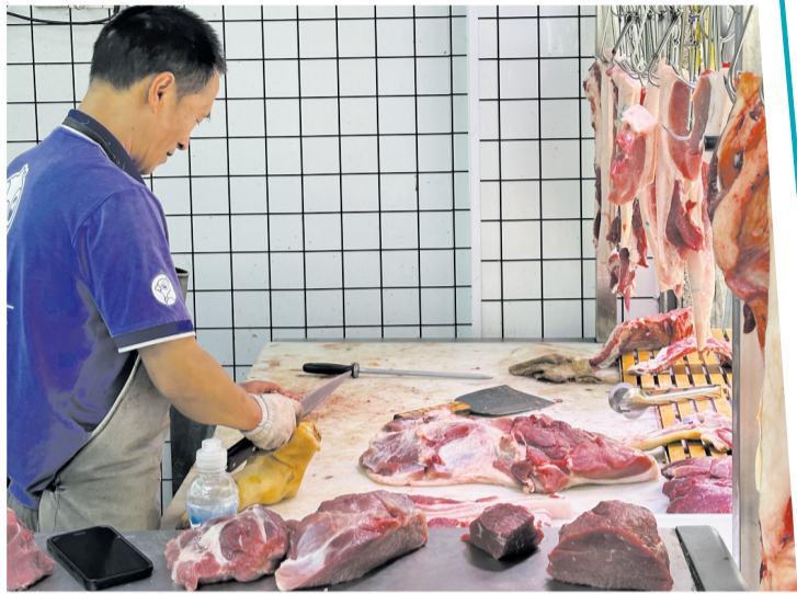
超市工作人员正在处理新鲜猪肉。

连日来,记者走访中心城区多家商超和农贸市场发现,猪肉价格持续走低。与此同时,养殖端面临成本等压力,市场供需弱格局仍在持续。对此,我市积极通过产能调控、金融信贷支持、保险托底等举措,助力相关产业平稳运行。