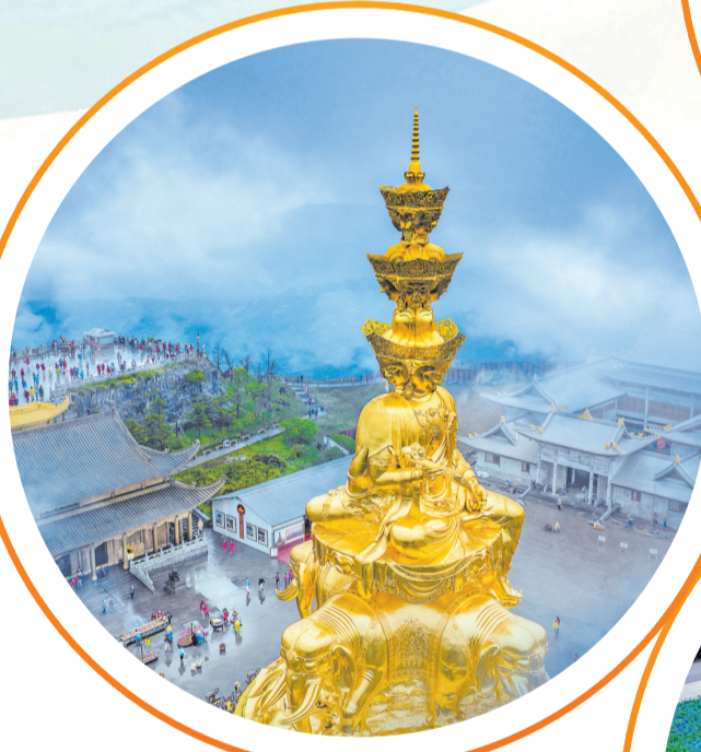
峨眉山金顶。