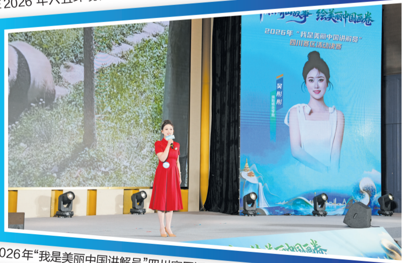
2026年“我是美丽中国讲解员”四川赛区活动决赛在峨眉山市举行。