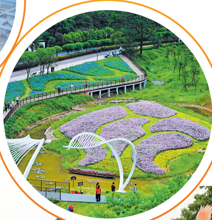
美丽的嘉州绿心公园一角。