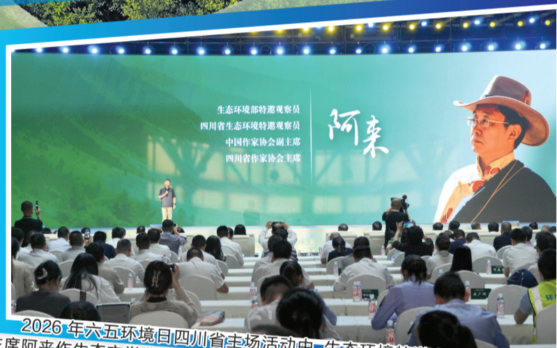
2026年六五环境日四川省主场活动中,生态环境特邀观察员、中国作协副主席阿来作生态文学分享。