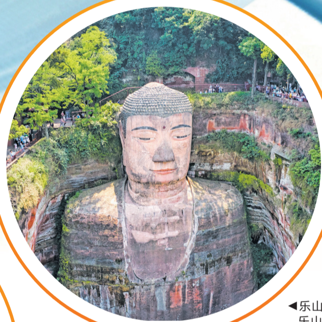
乐山大佛。