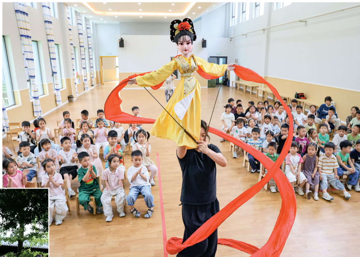
6月12日,在江苏省扬州市广陵区广福花园育树家幼儿园,扬州市木偶研究所演员在为小朋友们表演。

“文化和自然遗产日”即将到来,各地举办丰富多彩活动,人们了解非遗、体验非遗,感受传统文化的魅力。