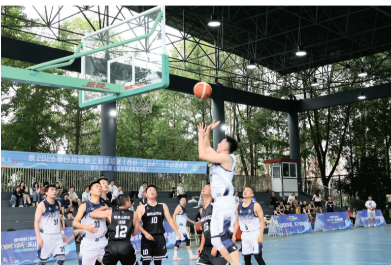
运动员们激烈比拼。

参赛,其中,区县组冠军将代表乐山出征四川省职工篮球联赛。 在简单而热烈的开幕式后,比赛正式拉开序幕。赛场上,球员们精神饱满、斗志昂扬,攻防转换快速流畅,传球、突围、投篮干净利落,充分展现了新时代乐山职工团结奋进、积极向上、敢于争先的良好精神风貌。精彩的比赛也感染了前来加油助威的观众。球员们的每一次突破、每一次抢断、每一次投篮都牵动着大家的心弦,一个个精彩瞬间引来了阵阵欢呼声和掌声。