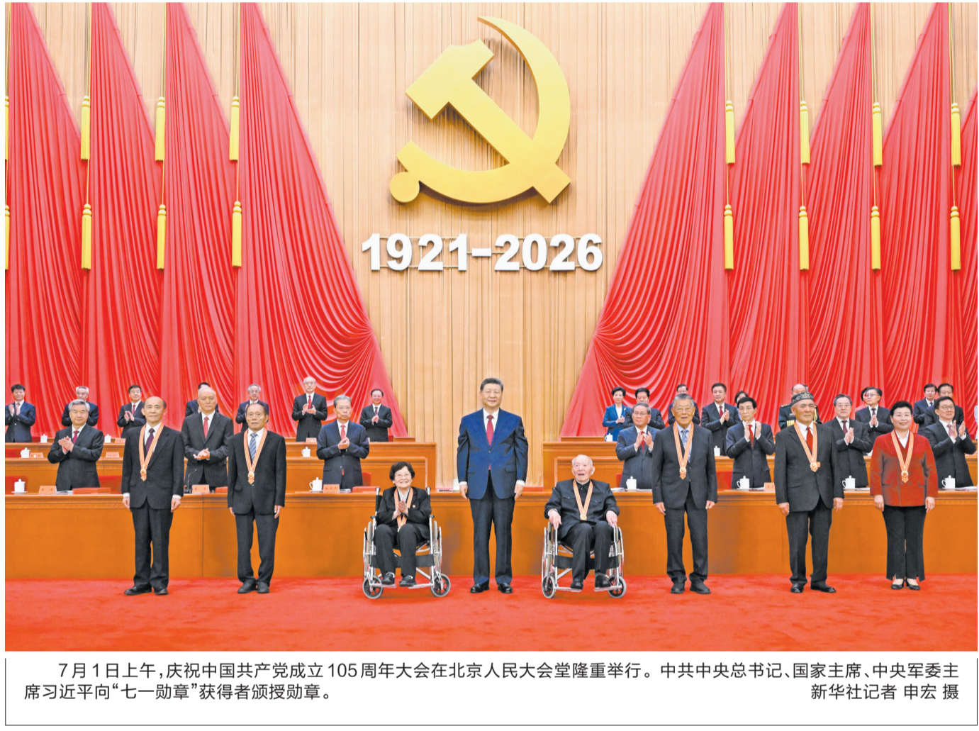
7月1日上午,庆祝中国共产党成立105周年大会在北京人民大会堂隆重举行。中共中央总书记、国家主席、中央军委主席习近平向“七一勋章”获得者颁授勋章。新华社记者 申宏 摄

新华社北京7月1日电 庆祝中国共产党成立105周年大会7月1日上午在北京人民大会堂隆重举行。中共中央总书记、国家主席、中央军委主席习近平向“七一勋章”获得者颁授勋章并发表重要讲话。他强调,105年来,我们党始终坚守为中国人民谋幸福、为中华民族谋复兴的初心使命,在不懈奋斗中创造了彪炳史册的伟大成就。新征程上,全党同志要坚定信心、接续奋斗,不断创造无愧于时代和人民的新业绩。