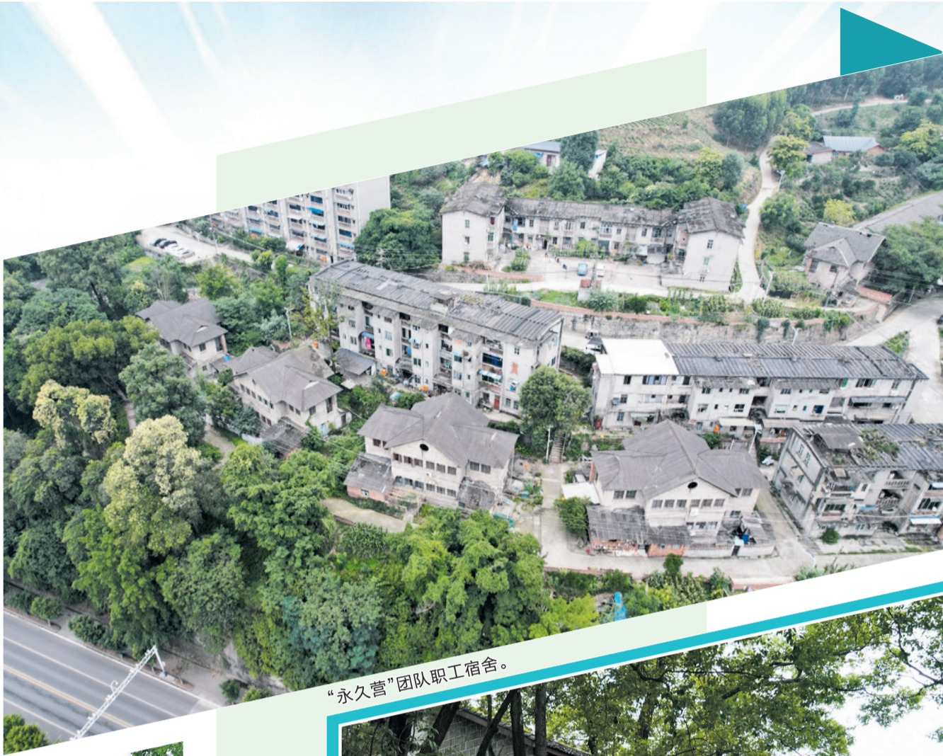
“永久营”团队职工宿舍。

近日,记者实地走进这片临江而立的老工业街区,触摸斑驳老建筑、探访完整工业遗存,近距离感受镌刻在山水厂区间的实业风骨与岁月荣光。