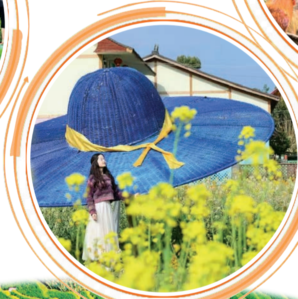
▲夹江县新场镇团结村美丽庭院绘就共富图景。