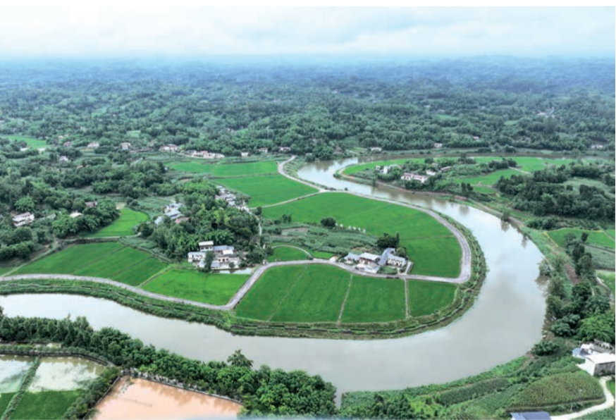
五通桥区冠英镇稻菜农业园区。