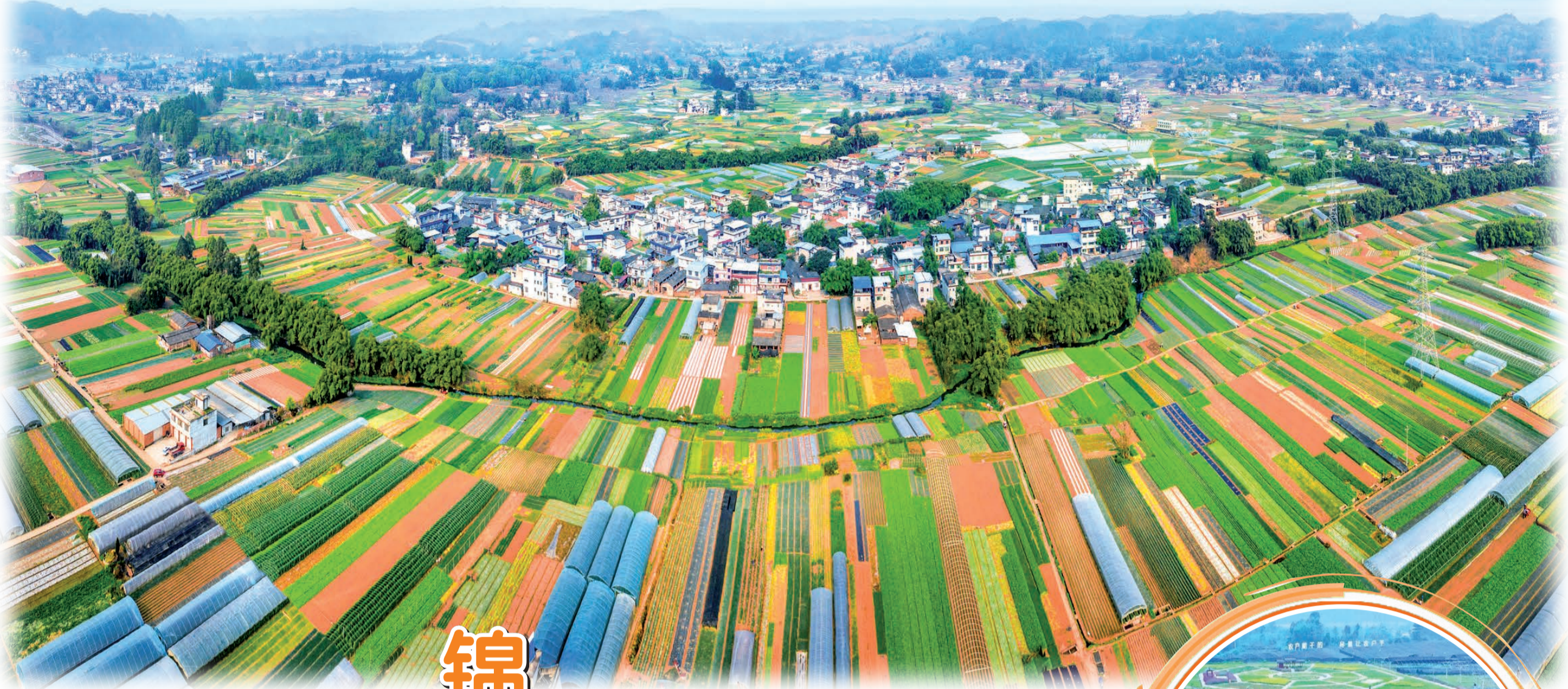
市中区牟子镇古儿坝依托香葱产业打造市民休闲“后花园”。