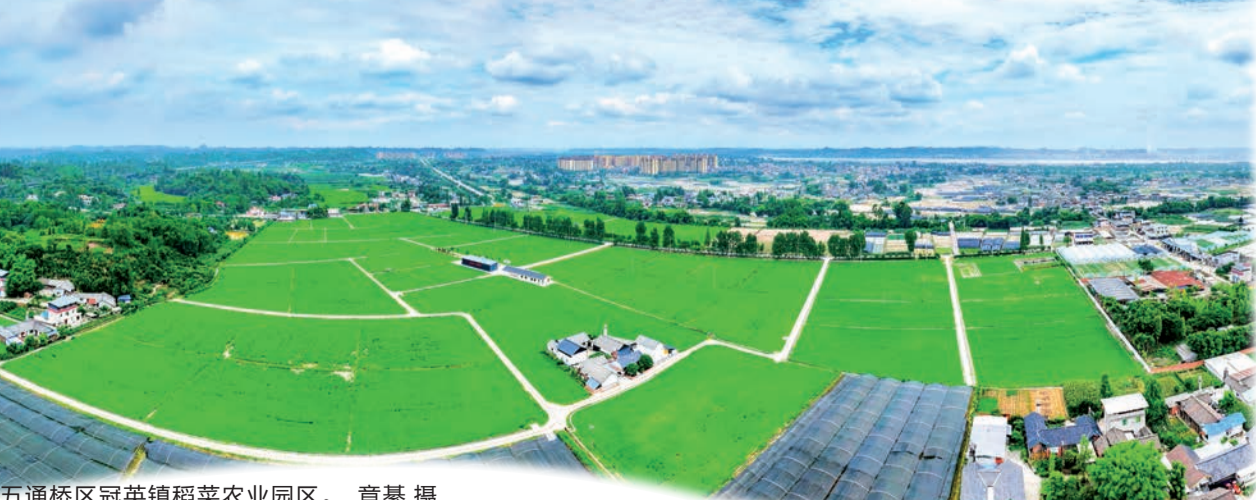
五通桥区冠英镇稻菜农业园区。