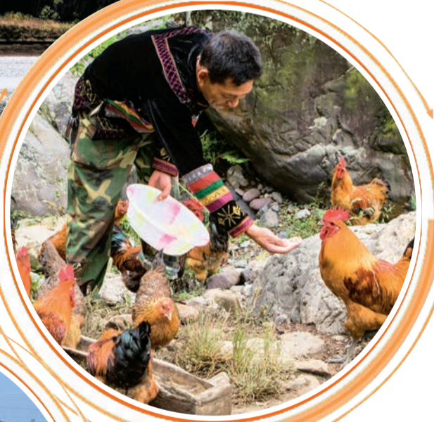
▲马边彝族自治县建设镇高石头村养鸡场助农增收。