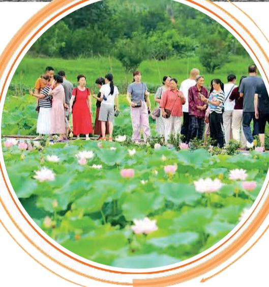
▲犍为县寿保镇以荷花为媒持续拉长乡村文旅产业链。