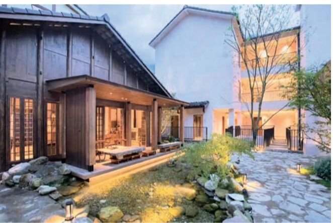
金口河区永胜乡精品民宿助力乡村文旅发展。