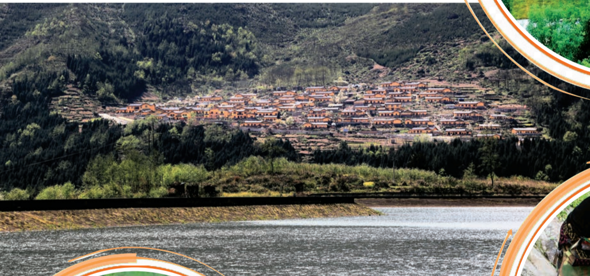
▲沙湾区太平镇明月农场探索“产业+文旅”融合发展路径。