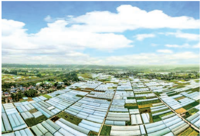
峨眉山市符溪镇战斗村大棚蔬菜基地。